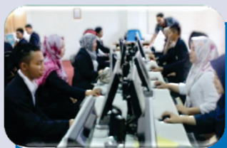
Ruang Laboratorium Komputer