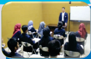
Ruang Micro Teaching