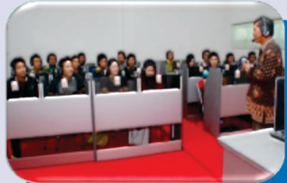
Ruang Laboratorium Bahasa